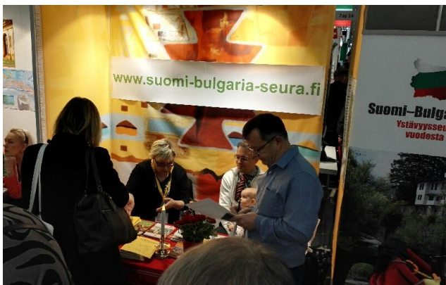
Liikettä Bulgaria-seuran ständillä.

Toivotan lukijoillemme hyviä elämyksiä tämän vuoden matkoilla. Vahvistakoon ne teitä henkisesti ja fyysisesti.