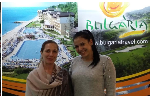
Bulgarian matkailuviraston edustajat.