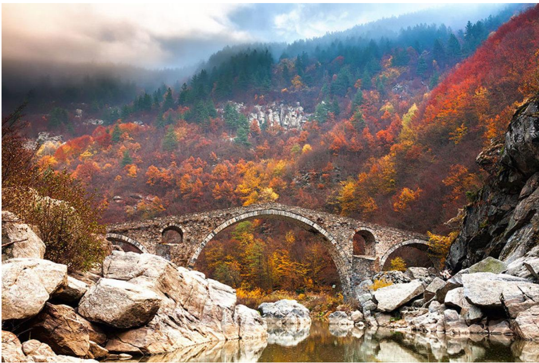
Vanha kivisilta "Paholaisen silta" Arda-joen yli Rodopeilla

Vuosien varrella suomalaiset ovat ehtineet kiertää Bulgariaa ristiin rastiin. Me voimme olla kokemuksen ja näkemämme perusteella hyviä arvioimaan bulgariaalaista kansallismaisemaa.