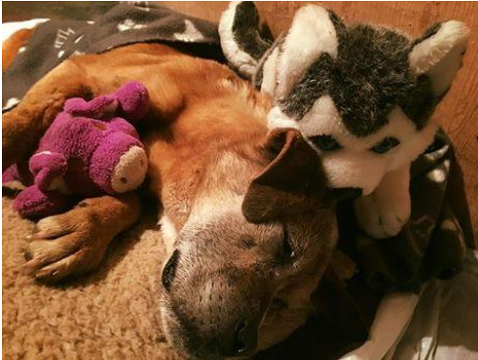
Päähän lyöty Hope saa varmaan ensi kerran elämässään hoivaa

onneksi kotihoitoon. Se ei kuitenkaan halua liikkua ja horjuu kävellessään. Koira on tarkoitus viedä pään magneettikuvaukseen, että vamman laajuus saadaan selvitettyä.