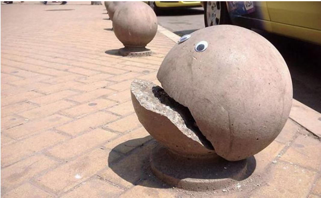
Bulgarialainen katutaiteilija Vanyu Krastev muuttaa rikkinäisen taiteeksi /M.L.