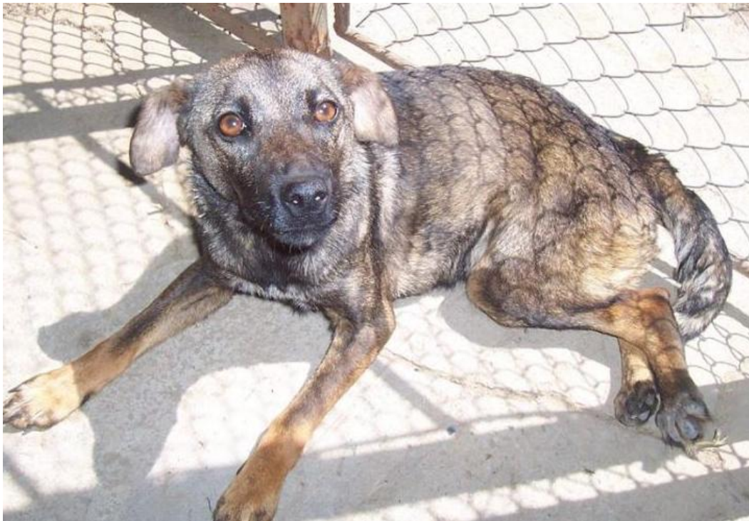
Halvaantuneelle Jessielle on luvattu pyörätuoli